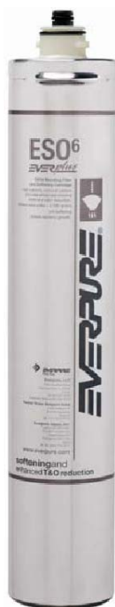
ESO6 Filterpatron Art.Nr: 9707-10